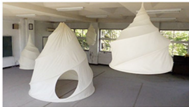
穂松 美早 / misa WEMATSU