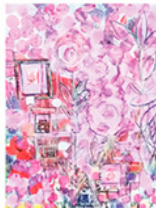
リュデュミラ・ダーコウバ Lyudmila DAKHOVA [ウクライナ]